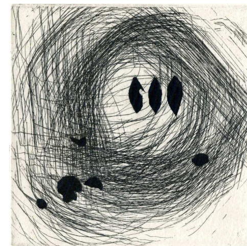
Kenjiro Azuma , Kokoro , 2009 Acquaforse originale dell'autore

Fuori collana , con testi di autori vari (quasi) sempre affiancati da opere grafiche originali di Luciano Ragozzino, che si divide fra i suoi ruoli di editore e di artista