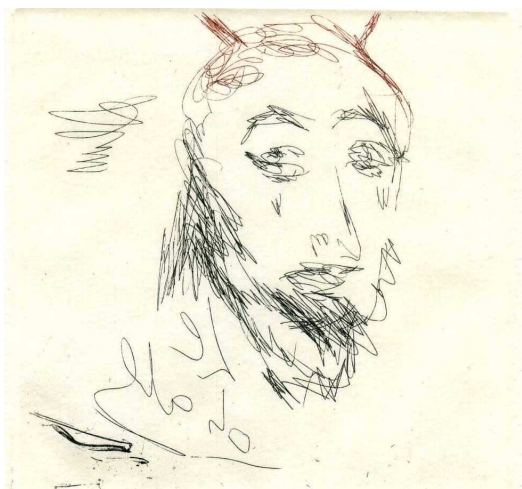
Alda Merini , Il diavolo è rosso , 2005 Acquaforse originale dell'autrice