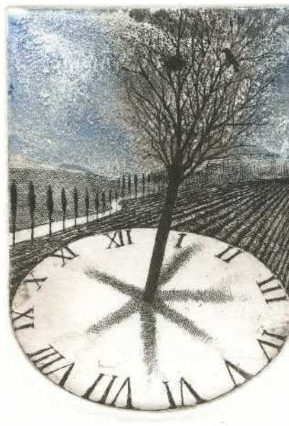
Philippe Jaccottet , Bere con gli occhi , 2011 Acquaforse-acquatinta di Luciano Ragozzino

Poesie e prose inedite di alcuni fra i più importanti autori italiani e internazionali sono sempre accompagnate da opere grafiche originali .